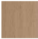
01 Rovere Naturale