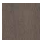
20 Rovere Castoro