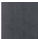
06 Rovere Grigio