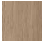
02 Rovere Silver