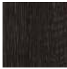
04 Rovere Brown