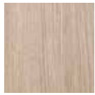
00 Rovere Sbiancato

Ausführungen und technische Eigenschaften