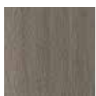
14 Rovere Terra