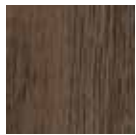
07 Rovere Siena