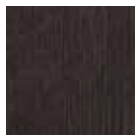
05 Rovere Wengé