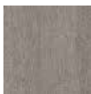
12 Rovere Concrete